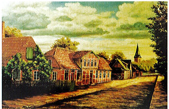
Dörpstrat in Fintel - Rotenburger Straße - Fintel -

36 qm mit 3-4 Schlafplätzen, sehr gepflegte Räumlichkeiten, ebenerdig, große Fensterflächen, Südausrichtung der Terrasse mit Blick auf den Garten mit Teich. Sep. Eingang. Küchenzeile im Wohn-/Essbereich. Sep. Duschbad. Preis/Nacht bei 2 Pers. 45,-€, Preis/Nacht bei 1 Pers.: 30,- € p.P., ab 3 Nächte: 25 € p.P., ab 1 Woche: 22,50 € p.P. Frühstück: 7,50 € p.P., Endreinigung 25,- €, Bettwäsche u. Handtücher inkl., PKW- u. Fahrrad-Stellplatz unmittelbar am Grundstück. Das Grundstück ist mit dichtem Strauch u. Baumbestand umgeben. In der Umgebung befinden sich hochwertige Ausflugslokale u. gemütliche Kneipen.