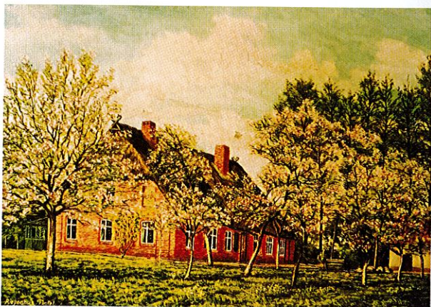
Riepenhus Fintel 1948

Ortskern, 1 Schlafzimmer, Wohnzimmer mit Küchenzeile, Dusche/WC, OG, TV, separater Eingang, Terrasse m. Grillmöglichkeit, Zustellbetten, Autostellplatz. Preis pro Tag 40 €.